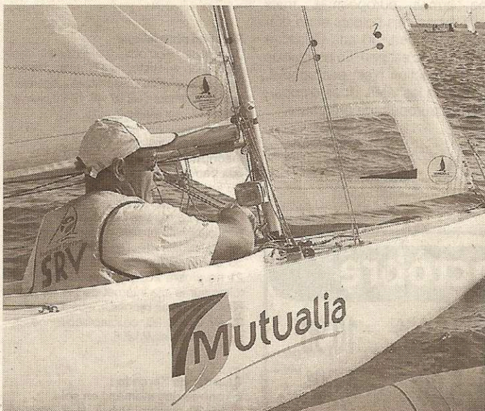
C'est sur la série 2.4 que le Vannetais prépare les Jeux paralympiques de Londres.